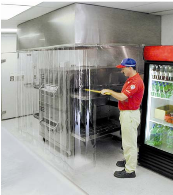
Ein durchsichtiger Ofen-Vorhang, der die heisse Abluft des Ofens direkt zur Abzugshaube führt.

Der Ofen-Vorhang, bei welchem Sie einen kühlen Kopf behalten, und erst noch Energiekosten einsparen !